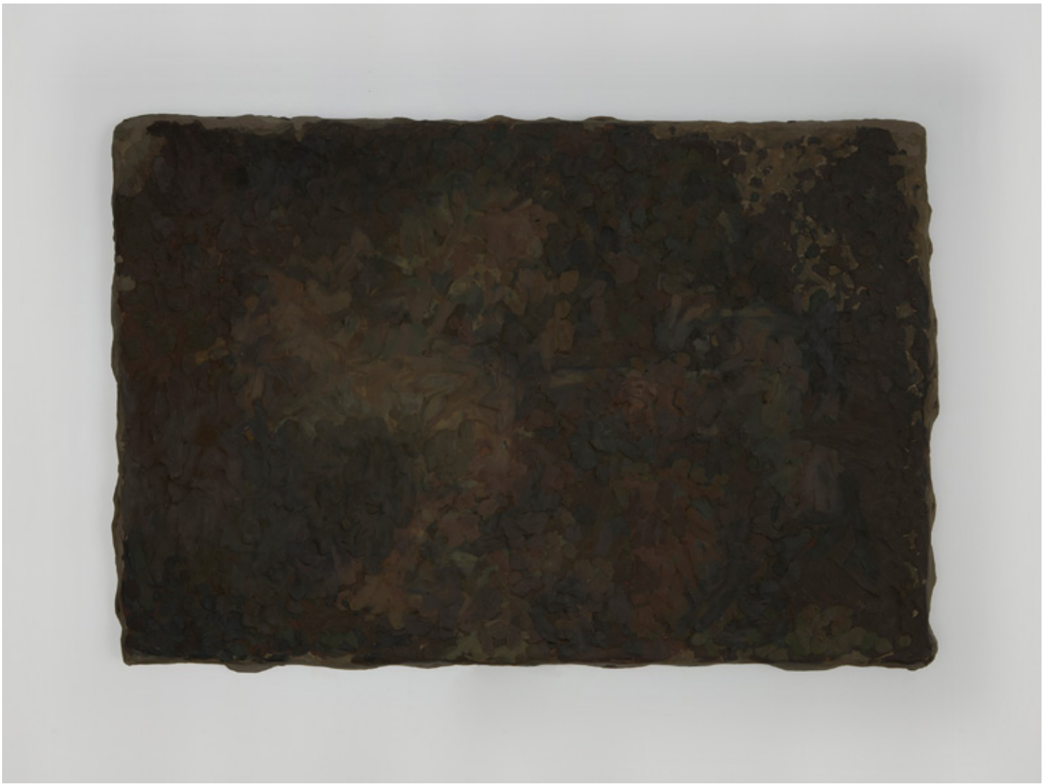
Fran Mohino Dark playdough 2 1989