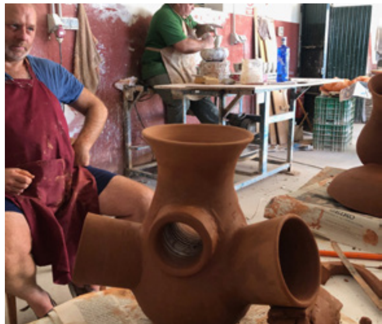
Proceso de experimentación y prototipado