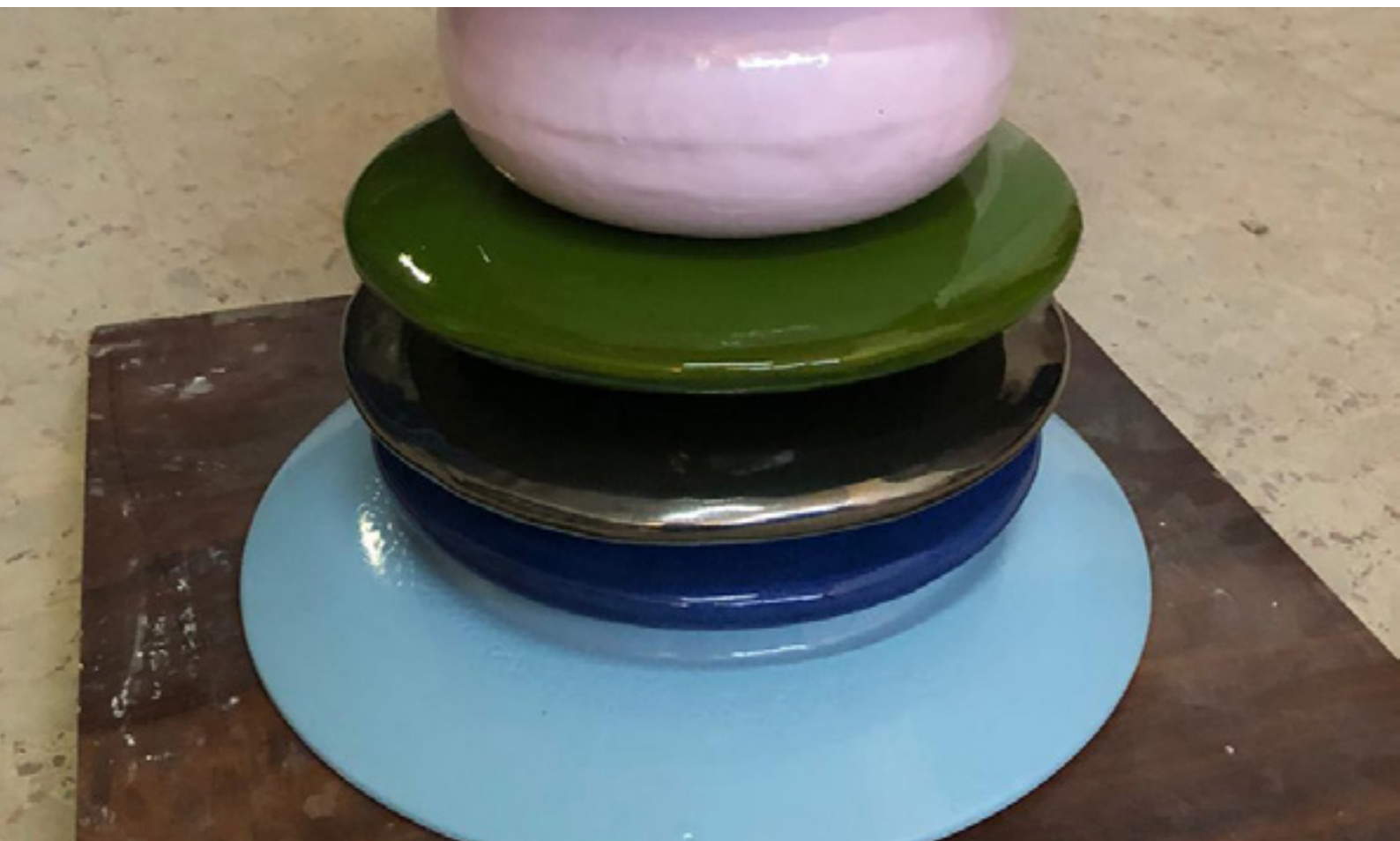
Proceso de diseño y desarrollo de "Table with Re-molde"